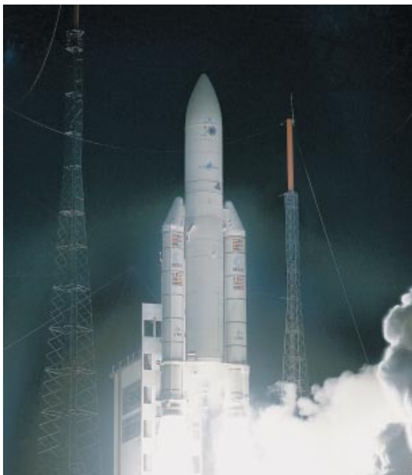
Abb. 2: Der Start von ENVISAT am 1. 3. 2002.

100 Minuten in einer mittleren Höhe von 800 km die Erde. Die Lebensdauer des Satelliten wird auf etwa fünf Jahre veranschlagt.