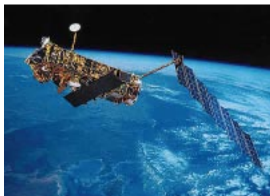
Abb. 1: Der Umweltforschungssatellit ENVISAT.

Am 1. März 2002 wurde ENVISAT mit einer Ariane-V-Rakete vom Weltraumbahnhof Kourou aus in seine polare sonnensynchrone Erdumlaufbahn geschossen. Der Satellit umkreist seitdem einmal in