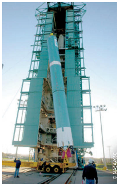
Delta-2-Rakete als Transporter der NOAA-Satelliten

Umlaufbahn zur Gruppe der polarumlaufenden Satelliten. Aufgrund der Flughöhe beträgt ihre Umlaufdauer ca. 100 min. Die polare Umlaufbahn ermöglicht es, die gesamte Erdoberfläche abzutasten. Dies erfolgt in bestimmten Zeitintervallen. Dadurch ist es schwierig, einen Wetterfilm für eine bestimmte Region zu erstellen.