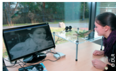
Auswertung einer Aufnahme im infraroten Bereich im DLR_School_Lab

Nach dem Kennenlernen der Komponenten der Empfangsanlage im DLR_School_Lab Neustrelitz erfolgt die Planung des NOAA-Empfangs. Mittels einer speziellen Software analysieren die Schüler den bevorstehenden Satellitenüberflug. Im Mittelpunkt stehen Empfangszeiten und -bereiche, Überflugdauer sowie die Flugbahnen der NOAA-Satelliten. Mittels eines für Schüler leicht selbst nachzubauenden Modells wird das Verständnis über die Vorteile der Anwendung von sog. Polarkoordinaten zur Orientierung im Raum zusätzlich